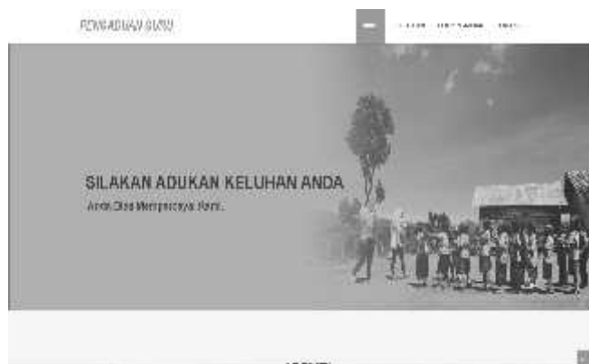
Gambar 2. Halaman Utama

Gambar 2 menunjukkan halaman utama aplikasi pengaduan dan informasi guru di mana user dapat melakukan pengaduan dan melihat informasi yang disediakan aplikasi ini.