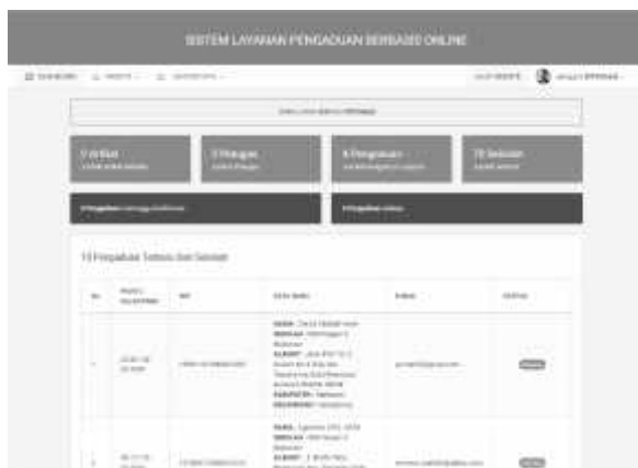
Gambar 3 Tampilan layanan pengaduan berbasis online

Gambar 3 menunjukkan halaman yang menampilkan artikel, petugas, pengaduan, dan jumlah sekolah yang menggunakan aplikasi. Informasi yang didapatkan berupa waktu pelaporan, NIP guru yang melapor, data guru yang mengadai, email, dan status.