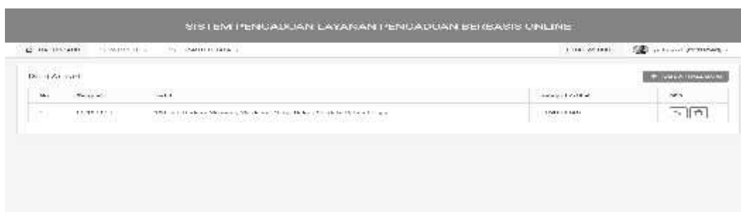
Gambar 4 Tampilan informasi artikel

Gambar 3 menunjukkan halaman yang menampilkan artikel, petugas, pengaduan, dan jumlah sekolah yang menggunakan aplikasi. Informasi yang didapatkan berupa waktu pelaporan, NIP guru yang melapor, data guru yang mengadai, email, dan status.