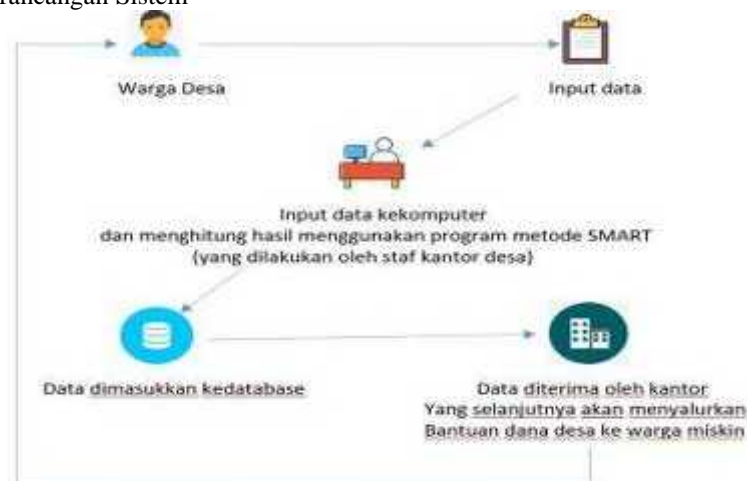
Gambar 1 Arsitektur Perancangan Aplikasi