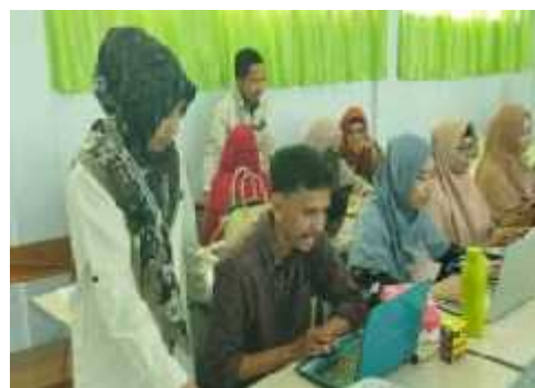
Gambar 4. Pendampingan Peserta