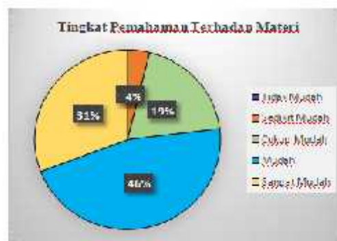
Gambar. 7 Tingkat Pemahaman Peserta Terhadap Materi

Setelah memberikan edukasi, pelatihan dan pendampingan, Tim Pengabdian memberikan post test kepada para peserta untuk melakukan penilaian dan mengukur sejauh mana tingkat pemahaman peserta terhadap materi yang diberikan. Berikut adalah bagan hasil post test yang dilakukan: