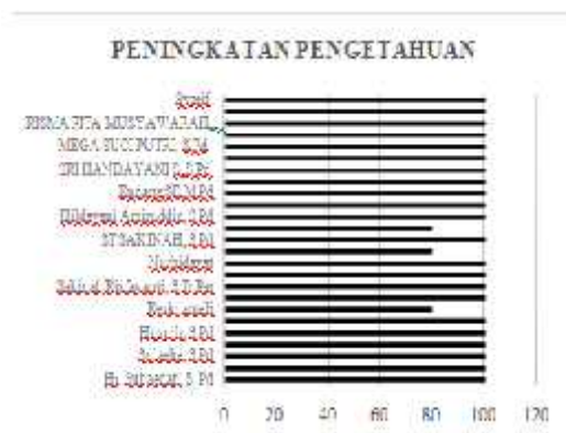
Gambar 8. Peningkatan Pengetahuan Peserta