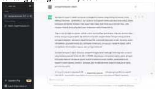
Gambar 5. Implementasi ChatGPT

mendapatkan referensi materi pembelajarannya hanya dengan mengetikkan keyword referensi apa yang diinginkan kemudian send a message. Secara cerdas ChatGPT akan menampilkan semua jawaban berdasarkan sumber yang valid. Seperti pada gambar 5, hanya dengan mengetikkan jaringan komputer adalah, maka akan muncul semua informasi tentang jaringan komputer.