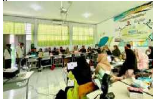
Gambar 3. Presentasi dan Pelatihan

tim pengabdian terlihat sangat antusias. Dalam upaya memahami materi yang diberikan dan mengimplementasikan penggunaan Google Drive, terjadi dialog dua arah (tanya-jawab) antara peserta dan penerbit dapat dilihat pada gambar 3 dan 4.