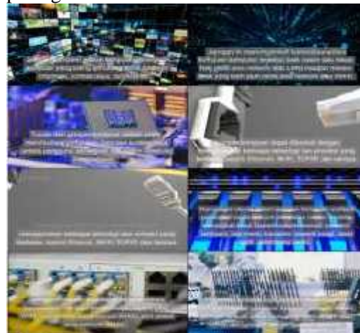
Gambar 6. Capture Scenes Video Menggunakan Pictory AI.

yang dibuat. Setelah itu video dapat disimpan dengan format MP4. Untuk tampilan hasil video pembelajaran yang dibuat dengan teknologi AI dapat dilihat pada gambar 6.