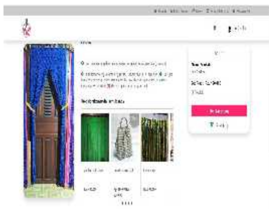
Gambar 5 Tampilan Rekomendasi produk

Dari perhitungan nilai support dan nilai confidence terbentuklah aturan asosiasi dimana aturan asosiasi tersebut di implementasikan ke dalam website toko LaKu. Berikut hasil rekomendasi produk yang dijadikan ke dalam bentuk tampilan website (Gambar 8) :