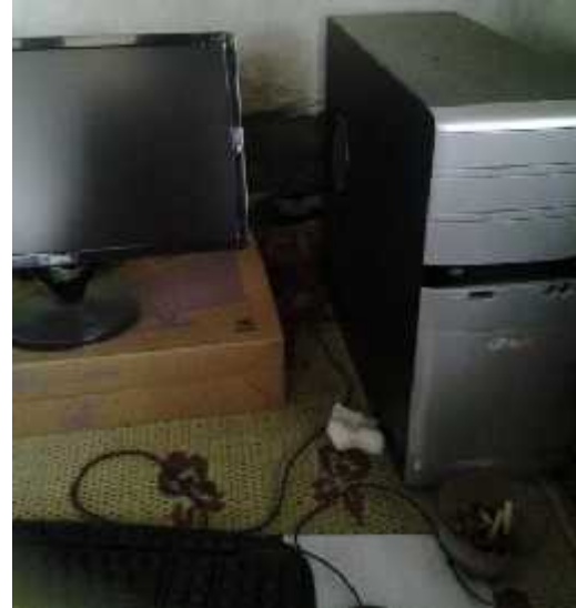
Gambar 2. Seperangkat Komputer dan modem internet

komputer di program pengabdian ini adalah untuk mencatat laporan keuangan, mencatat barang pemesanan dan barang produksi.