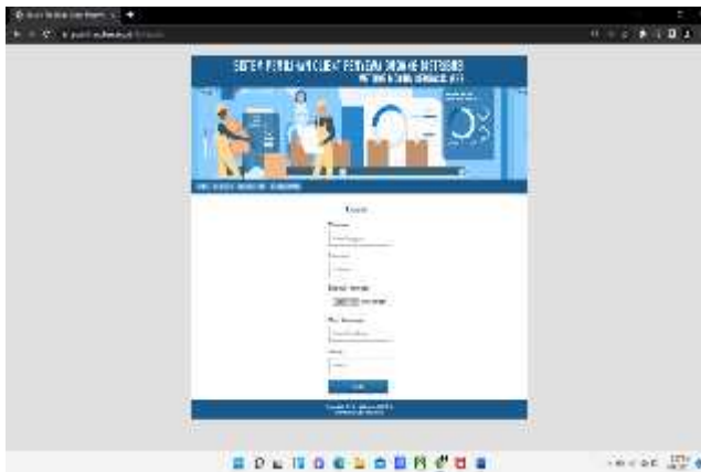
Gambar 4 Tampilan Register

Pada gambar 4 merupakan tampilan halaman register , yaitu harus mendaftarkan diri sebagai calon client dan memasukkan data dikolom yang telah tersedia, setelah itu menekan tombol daftar, jika telah selesai maka dapat dipakai sebagaimana mestinya.