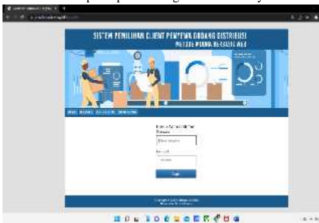
Gambar 5 Tampilan Login Administrator

Pada gambar 4 merupakan tampilan halaman register , yaitu harus mendaftarkan diri sebagai calon client dan memasukkan data dikolom yang telah tersedia, setelah itu menekan tombol daftar, jika telah selesai maka dapat dipakai sebagaimana mestinya.